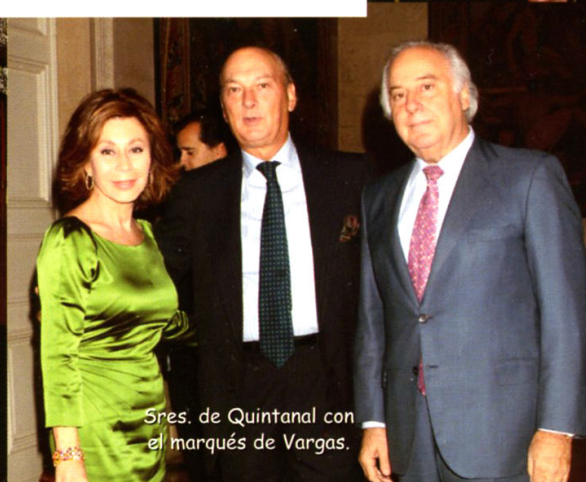
Sres. de Quintanal con el marqués de Vargas.