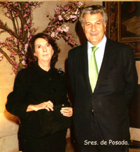
Sres. de Posada.