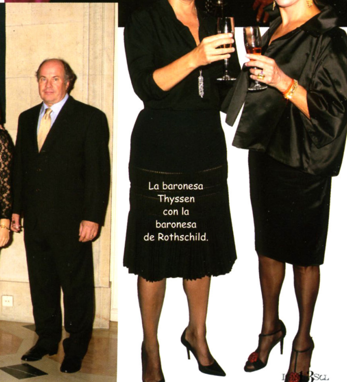
La baronessa Thyssen con la baronessa de Rothschild.