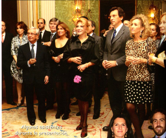
Algunos asistentes durante la presentación.