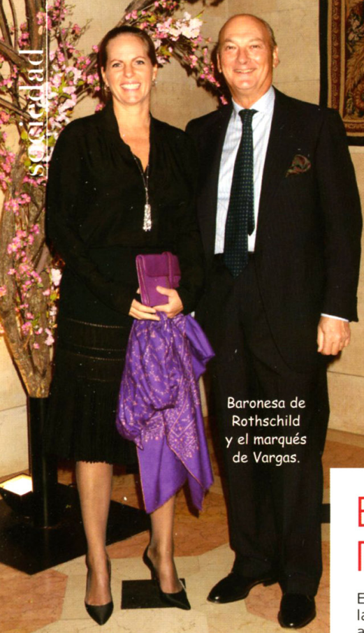
Baronesa de Rothschild y el marqués de Vargas.