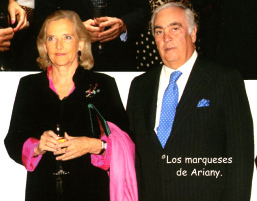
Los marqueses de Ariany.